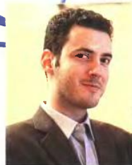
Το OpenFund στο οποίο συμμετέχει η Τράπεζα Πειραιώς έχει ολοκληρώσει ήδη τον πρώτο κύκλο επιλογής start-ups, ήξει ο Γ. Κασσελάκης.

Τα κεφάλαια που λαμβάνει μια επιχείρηση για να χρηματοδοτήσει την ανάπτυξη της και τα οποία συνήθως υπερβαίνουν τις 500.000 ευρώ. Αυτού του είδους την ανάπτυξη χρηματοδοτούν κυρίως τα Venture Capital όπως είναι το Oxygen Capital, η Attica Ventures, το TANEΟ κ.λπ.