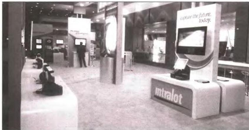
Στο αναπτυξιακό εργαλείο των clusters, επενδύει η Intralot στηρίζοντας ενεργά και προσβλέποντας σε ευκαιρίες συνεργασίας με καινοτόμες ελληνικές επιχειρήσεις, για από κοινού ανάπτυξη και πρόσβαση σε μια δυναμική αγορά με παγκόσμια εμβέλεια...

Για ίδρυση Gaming Innovation Cluster στην Ειθιάδα