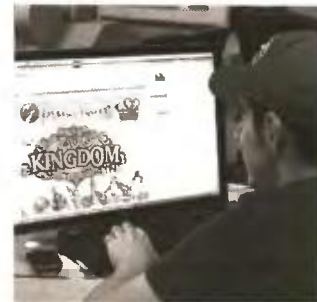
Συνεργασία της INTRALOT με το Corallia Clusters Initiative