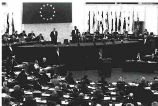
Στο συνέδριο θα συμμετάσχουν ως ομιλητές ευρωβουλευτές και στελέχη της Ευρωπαϊκής Ένωσης

Το συνέδριο έχει θέμα «Νομοθεσία και Πολιτικές της Ευρωπαϊκής Ένωσης για την Περι-